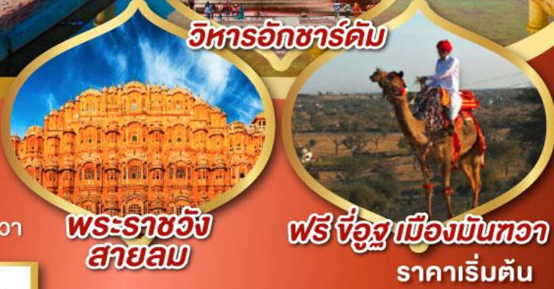
วิหารอักขารัติม