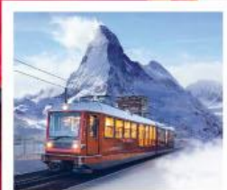
รถไฟเขารอนเนอร์เกรต