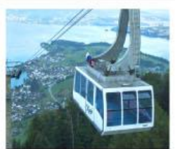
ขึ้นกระเช้ายอดเขารีกิ