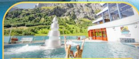
แช่น้ำแร่ร้อนผ่อนคลายลวยคอร์บิต