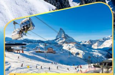
นั่งกระเช้าชมแมกเทอร์ฮอร์น