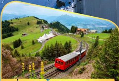
นั่งรถไฟขึ้นสู่ยอดเขาโรติก