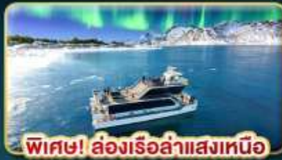
พิเศษ! ล่องเรือสำแสงเหนือ