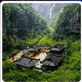
อุทยานแห่งชาติหลุมบ่อฟ้า