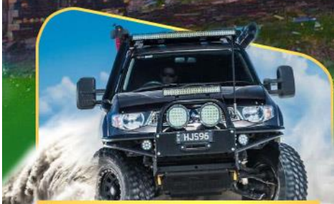
คันรถ 4WD สู้อีกกลางเทือกเขาคอเคซัส