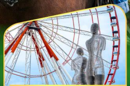
อนุสาวรีย์อาลีและนีโน่