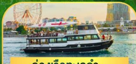
ล่องเรือทะเลดำ