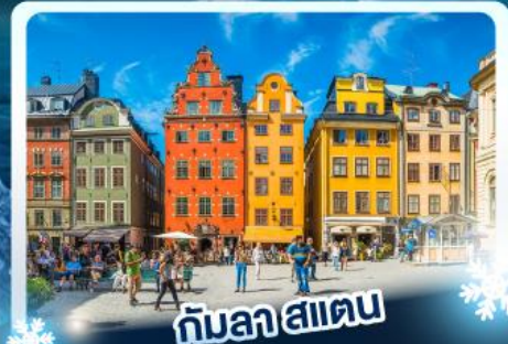
กับลาสาเตน