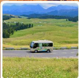
ทุ่งหญ้าเจียนปูลาเค่อ