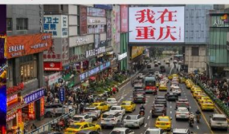
กวนอิมเจียว

*ทางบริษัทฯ ขอสงวนสิทธิ์ในการสลับโปรแกรมทัวร์ตามความเหมาะสมขึ้นอยู่กับสถานการณ์หน้างาน โดยคำนึงถึงผลประโยชน์ของลูกค้าเป็นสำคัญ