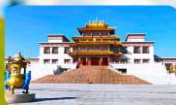
คฤหาสน์พุทธบูชาแห่งชีวิคยูลาน