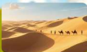
เนินทรายอินเคินทาลา