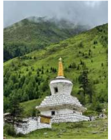
ที่สวยงาม อิสระพักผ่อนชมวิวะระหว่างทางจน