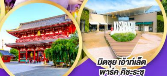
มิตซูเอะอิเกะอิเล็ค พาร์ค คิชะระชู