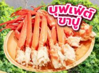
บุฟเฟ่ต์ ซาซุ