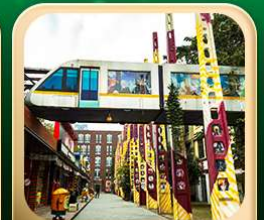
“ตงเจียวจื่อ”