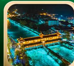
“สะพานหนานเฉียว น้ำคาสีฟ้า”