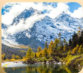
“ปี่ผิงโกว”

ชมธรรมชาติ 2 อุทยานขึ้นชื่อ อุทยานภูเขาสี่ครุณี + อุทยานปี่ผิงโกว สะพานหนานเฉียว • ถนนคนเดินไท่กู่หลี่ + ซุนซีลู่ + Pop Mart • ตงเจียวจื่อ