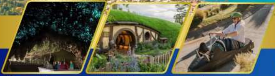
ถ้ำหอนเรื่องแสง หมู่บ้านฮ็อบบิต เล่นลู่ที่ควีนส์ทาวน์

AUCKLAND / ROTORUA / CHRISTCHURCH FOX GLACIER / FRANZ JOSEF / QUEENSTOWN พักอ็อคแลนด์ 2 คืน / โรโตรัว 1 คืน / พักโครสต์เชิร์ช 2 คืน พักฟรานซ์โจเซฟ 1 คืน / ควีนส์ทาวน์ 2 คืน