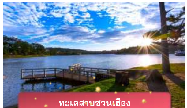
ทะเลสาบชวนเอื้อง

ที่พัก The Western Hill ระดับ 4 ดาวหรือเทียบเท่า