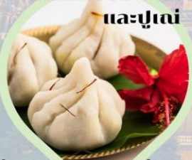
รับชุดสักการะฟรี! ท่านละ 1 ชุด