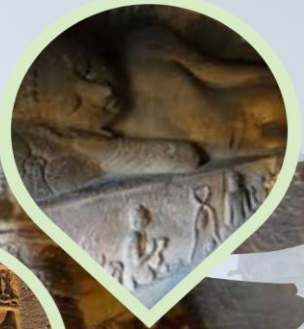
นั่งชมถ้ำพระพุทธศาสนา เทวสถานอชันต้า