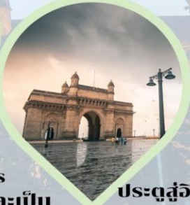
ประตูสู่อินเดีย (Gateway of India) อ่าวมุมไบ Arabian Sea