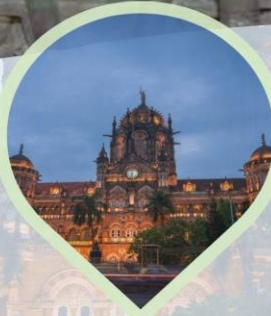
ชม Victoria Terminus สถานีรถไฟประวัติศาสตร์และเป็น มรดกโลกของยูเนสโก