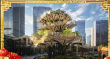
XIAN TREE&MIXC MALL