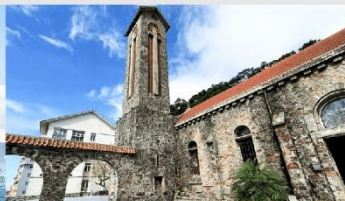
โบสถ์หินตามด้าว