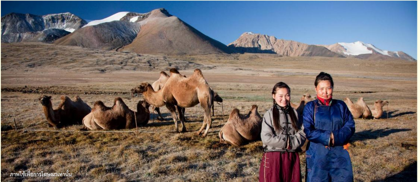
ภาพใช้เพื่อการโฆษณาเท่านั้น

นำท่านร่วมกิจกรรม พิธีต้อนรับแขกสไตล์มองโกล เป็นประเพณีโบราณที่มีมาช้านาน ชาวมองโกลมีอุปนิสัยที่รักเพื่อนฝูงและตรงไปตรงมาไม่เสแสร้ง เมื่อมีเพื่อนหรือแขกมาเยือนก็มักจะผูกมิตรอย่างจริงจัง และนำท่านร่วมกิจกรรม สวมใส่ชุดมองโกล สัมผัสพลังแห่งบรรพบุรุษ สวมเสื้อคลุมแบบดั้งเดิมที่มีสีสันสดใส ปักลวดลายอันประณีต คุณจะสัมผัสได้ถึงพลังแห่งบรรพบุรุษที่เคยปกครองดินแดนครึ่งโลก การสวมหมวกขนสัตว์ ผูกสายรัดเอว พร้อมเครื่องประดับเงินแท้ที่ส่องแสงระยิบระยับ จะทำให้ท่านเสมือนกลายเป็นนักรบแห่งทุ่งหญ้า พร้อมเครื่องประดับเงินแท้ที่ส่องแสงระยิบระยับ ของชนเผ่าที่เคยปกครองดินแดนครึ่งโลก เมื่อคุณยืนท่ามกลางทุ่งหญ้าไร้ขอบเขต