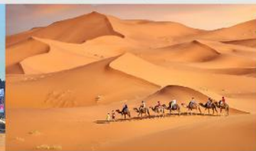
ทะเลทรายเสี่ยงชวาน