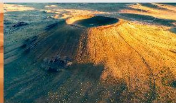
ภูเขาไฟอูลันฮาตา

*ทางบริษัทฯ ขอสงวนสิทธิ์ในการสลับโปรแกรมทัวร์ตามความเหมาะสมขึ้นอยู่กับสถานการณ์หน้างาน โดยคำนึงถึงผลประโยชน์ของลูกค้าเป็นสำคัญ