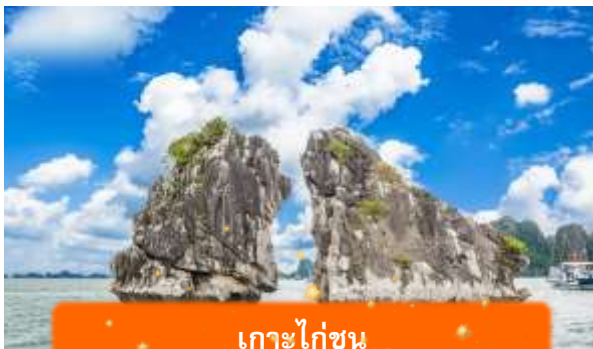
เกาะไก่อ๋น

เที่ยง บริการอาหารกลางวัน ณ ภัตตาคาร พิเศษ ... เมนูซีฟู้ดบนเรือ