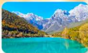
ทะเลสาบโป๋สุยเหอ