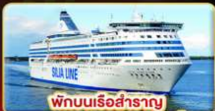
พักบนเรือสำราญ แบบ Window Room 2 คืน