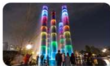
น้ำพุไม้ไผ่