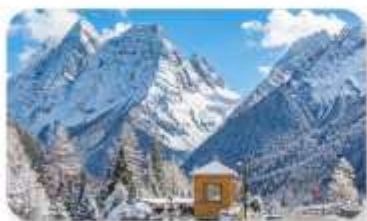
ภูเขาสี่ครุณี