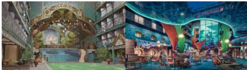
DISNEY IMAGINATION GARDEN

ก้าวออกไปยัง ระเบียงส่วนตัวของคุณ เพื่อดื่มด่ำกับทิวทัศน์อันงดงามตระการตา ไม่ว่าจะเป็น วิวมหาสมุทร, DISNEY IMAGINATION GARDEN หรือ DISNEY DISCOVERY REEF ที่คุณสามารถ เพลิดเพลินได้อย่างสบายจากภายในห้องพักของคุณ