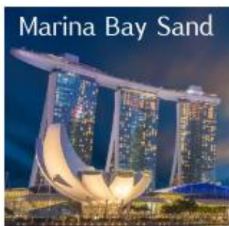
Marina Bay Sand

นำท่านเดินทางสู่ สิงคโปร์ มีชื่ออย่างเป็นทางการว่า สาธารณรัฐสิงคโปร์ เป็นนครรัฐสมัยใหม่และเป็นประเทศที่เป็นเกาะขนาดเล็กที่สุดในเอเชียตะวันออกเฉียงใต้ ประเทศบนเกาะเล็กๆ แต่มากด้วยความเจริญทางเศรษฐกิจ ที่รวบรวมความหลากหลายทางวัฒนธรรมและความทันสมัยได้อย่างลงตัว ถึงแม้สิงคโปร์จะมีพื้นที่ใช้สอยค่อนข้างจำกัด แต่นี่ก็กลับมีแหล่งท่องเที่ยวสวยๆ มากมายไว้คอยให้ผู้คนจากทุกสารทิศได้ไปเที่ยวและพักผ่อนกัน และด้วยความสวยงามอลังการของสถานที่ท่องเที่ยว