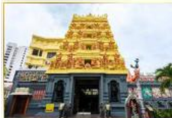
• Sri Senpaga Vinayagar Temple