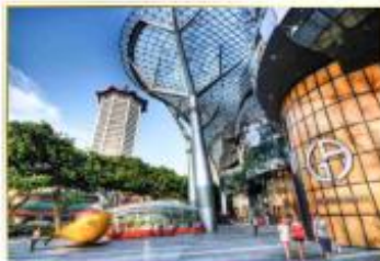
• Orchard Road