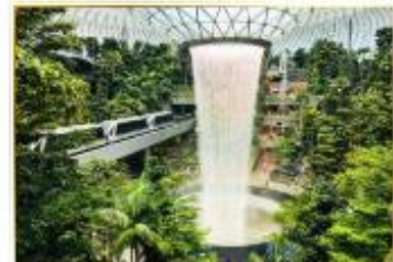
• HSBC Rain Vortex