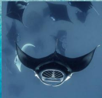
Manta Ray Snorkeling